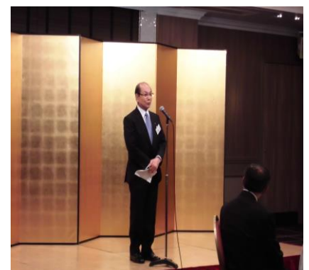
総会であいさつされる平野新会長 祝辞を述べられる佐野商工労働部長(当時) 退任の挨拶をされる北村前会長