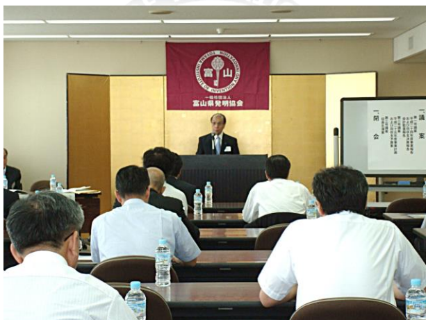
平成25年度 一般社団法人富山県発明協会総会