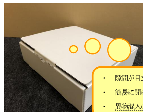
[本作品] 施錠機能付き密封型パッケージ