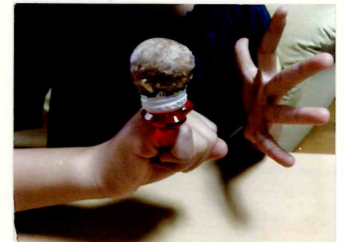
アボカドの指輪の完成