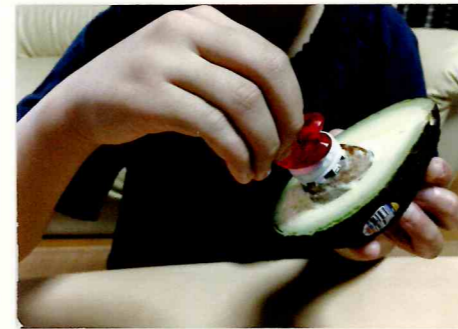
種につきさしている様子