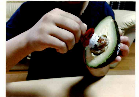
種を押しながら回している様子