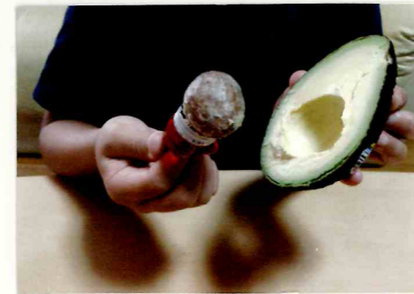
種をすくうように取る様子