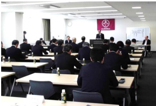
一般社団法人富山県発明協会 令和元年度総会