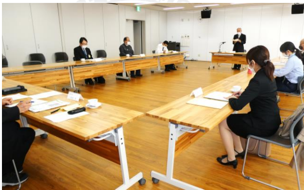
令和3年度少年少女発明クラブ懇談会