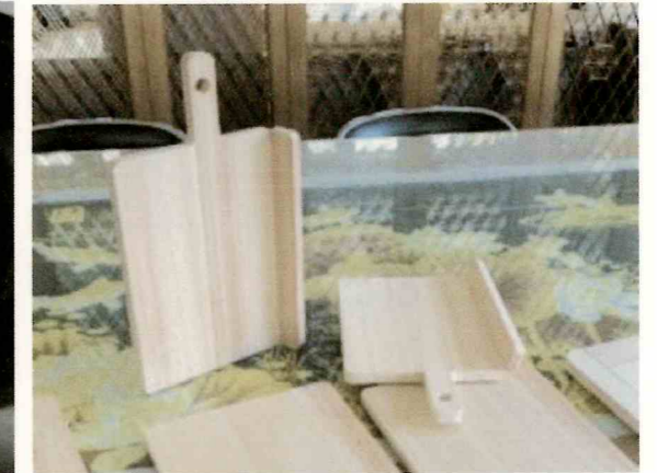
【直角に折り曲げた状態②】