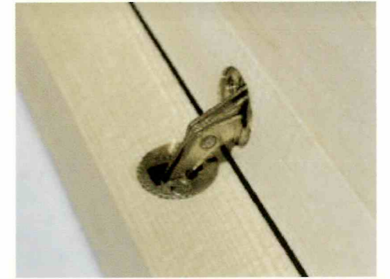
【ヒンジ(蝶番)部分の拡大写真】