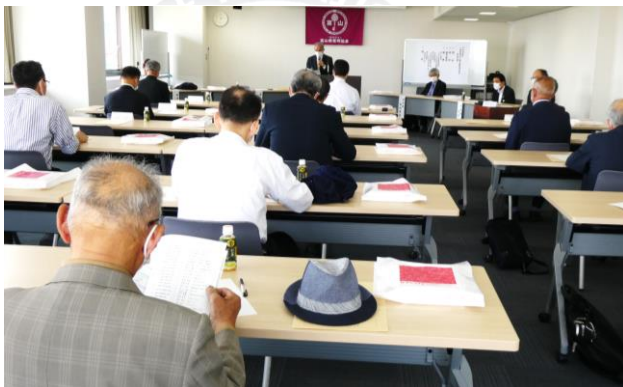
令和4年度 通常総会