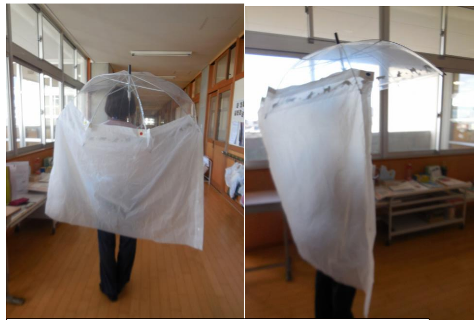
同じシールが付いた磁石にはりつくと、誰でも簡単にカバーを取り付けることができます。強力磁石で、取り外しも簡単です。

略図 (鉛筆書きでもよい) 又は写真を貼り付けて作品の特徴を説明して下さい。 (※審査用にコピー (縮小) しますので、濃く見やすく作成してください。)