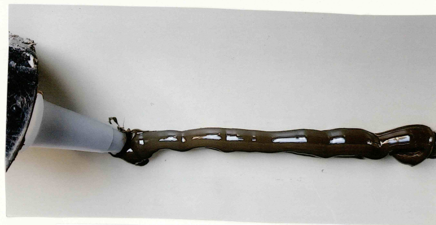
カートリッジ式コーキング からコーキング出した場面

略図、図面、写真等で、簡単に特徴を記入して下さい。(※太枠内でご記入ください) (※審査用にコピー(縮小)しますので、濃く見やすく作成してください。)