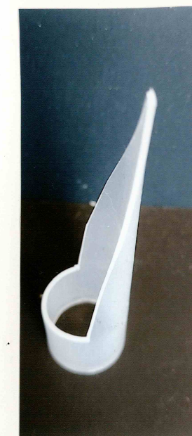
ノズル詰まり除去具