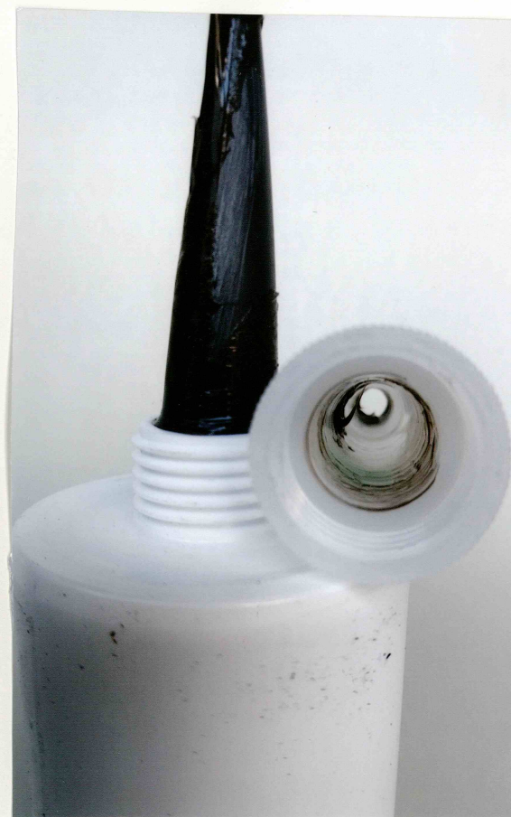
コーキングと除去具の使用後