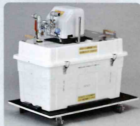
まかないくん水道ポンプ MNK-JP-400S