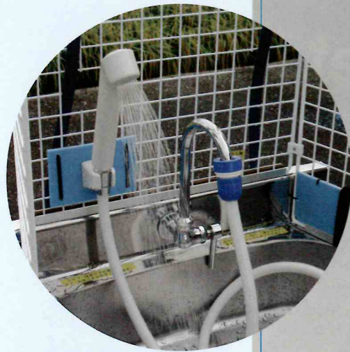
シャワー・手洗い

ポンプで水を高い位置に揚げ、落差での水使用ができるようになった事で（特許出願）手洗のほかシャワーによる洗髪など災害時の感染症対策として役立つ機能が生まれました。