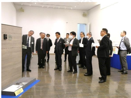
第61回富山県発明とくふう展・第32回未来の科学の夢絵画展