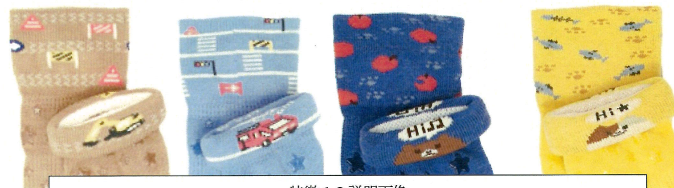
特徴 1-3 説明画像

詳細は、弊社 HP 参照ください⇒ https://store.sukeno.co.jp/pages/itsumomaemukikutsushita