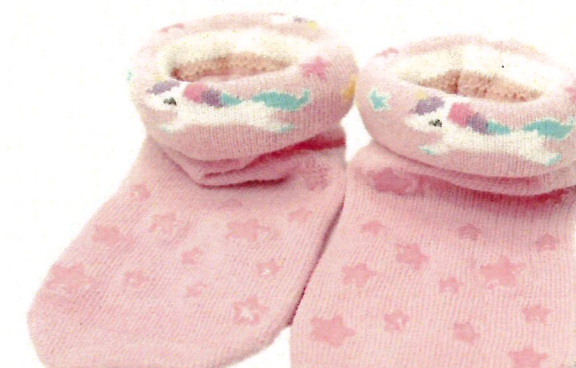
特徴 1-2 説明画像