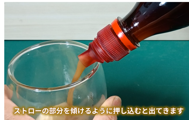
ストローの部分を傾けるように押し込むと出てきます