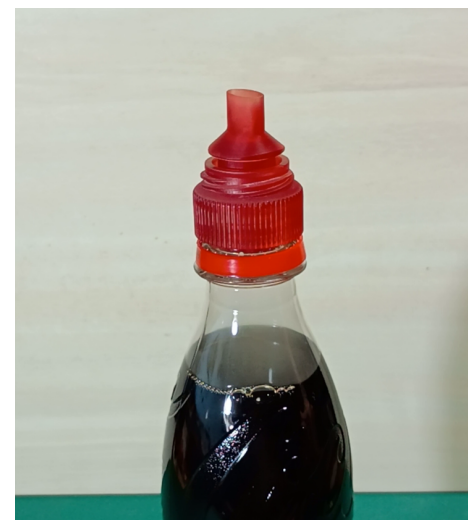
ペットボトル取り付け時