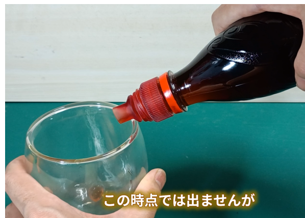
この時点では出ませんが